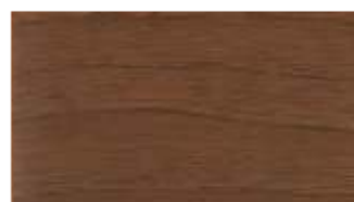
52 - siena rosso**