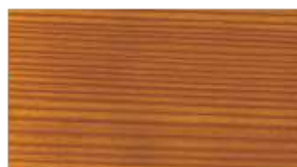
43 - oregon**