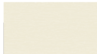
14 - biel kremowa