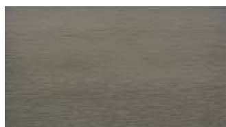
61 - szary kwarcowy*