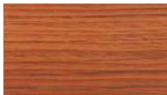
24 - wiśnia daglezja**