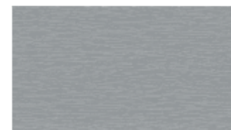
99 - szary