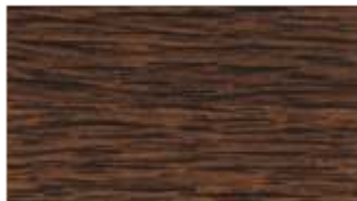
33 - dąb ST-G**