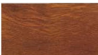
48 - złoty dąb