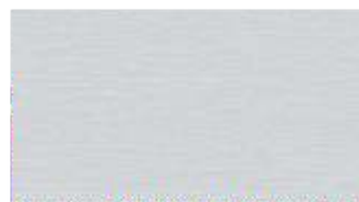
94 - szary jasny