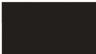
11 - palisander