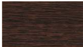
34 - dąb bagienny