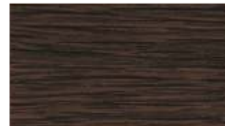
38 - dąb ciemny**