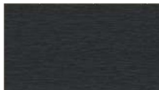
12 - antracyt