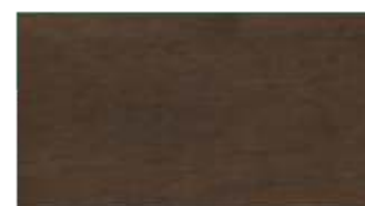
53 - siena nocte**