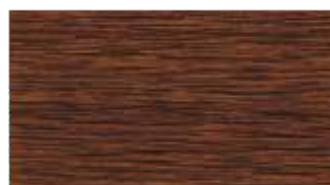
30 - orzech