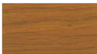
54 - winchester