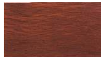
25 - macore**