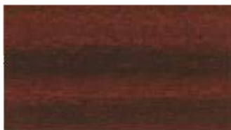
22 - mahoń